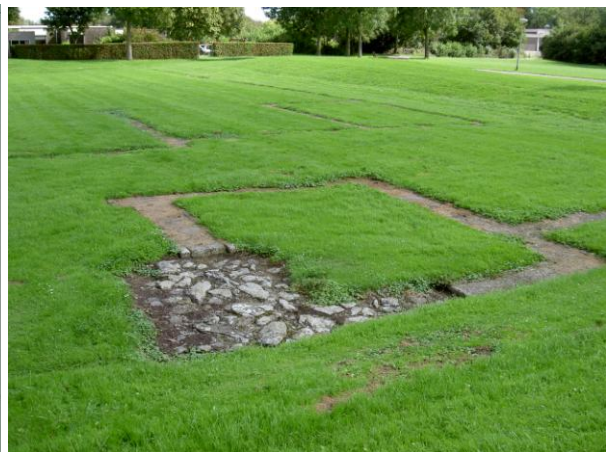
Een moment-opname van het Romeinse Rijk met in de Nederlanden een ikoontje voor de stad Xanten tussen Keulen en Nijmegen (links), en rechts de resten van een Romeinse versterking in Zwammerdam