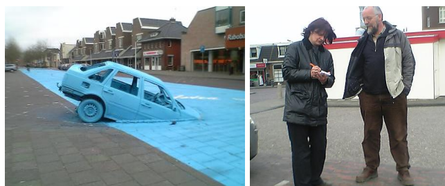
Links een kunstwerk waarin men laat zien hoe de grote weg in Drachten (een pronkstuk van de jaren 60) binnenkort weer 'vaart' en bevaarbaar wordt. Een wat oudere Drachtenaar (ca 58 jaar op de foto) wordt ondervraagd door een journalist van de NRC over wat hij nu 'wel niet' vindt van het feit dat de vaart weer open wordt gegraven die 40 jaar geleden werd dichtgegooid. Toevallig stond deze Drachtenaar 40 jaar geleden ook in de krant op de foto toen ongeveer op dezelfde plek de laatste brug (de tsjerkedraei) werd gelicht 'in naam der vooruitgang'.

Samen met een vriend (Harm de Vries) zat ik eens te mijmeren over dit soort veranderingen en omdraaiingen. En toen kwamen we met een willekeurig lijstje, het zal wel niet helemaal goed zijn maar toch is het aardig om naar te kijken: