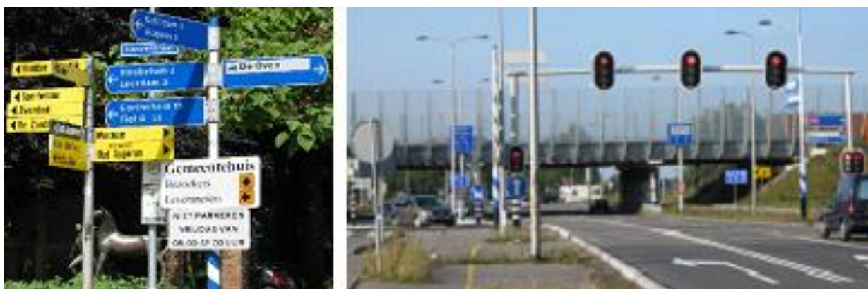
Vele 'wazige' richtingen om te kiezen, in Asperen maar ook in Zwolle ...