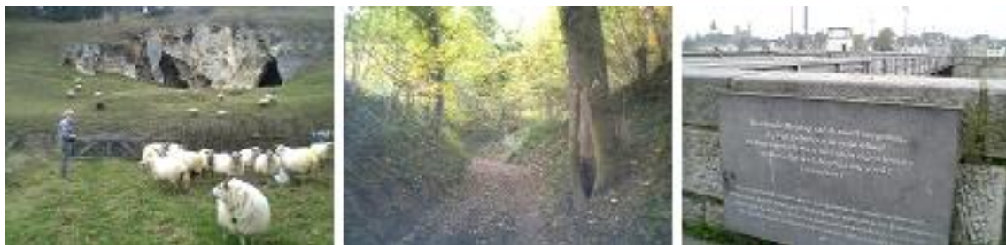
Een kudde Mergellandschapen die soms letterlijk onder de grond verblijft in de grotten van Zuid Limburg (links), een 'holle weg' (midden) en een gedenkplaat voor wereldoorlog II aan de 2000 jaar oude brug van Maastricht

Wij zitten nu in een andere tijd. In Nederland - en zeker ook in Limburg - is vanaf de jaren 90 het besef gegroeid dat wij anders moeten omgaan met ons watersysteem, een en ander werd nog versterkt door de verandering van het klimaat. Ondermeer door het verloren gaan van de sponswerking van de bodem werd verdroging in de hand gewerkt, terwijl in natte tijden de afvoerpieken verhevigden. Voor Limburg zit daar nog een aparte dimensie aan. Onderzoek toonde aan dat in het gehele stroomgebied van de Maas, tot in Frankrijk toe de sponswerking sterk was afgenomen als gevolg van het volbouwen van het winterbed, ontbossingen en beeknormalisaties. Watersysteemherstel werd een belangrijk speerpunt van het Limburgs waterbeleid. Samen met de waterschappen werd vanaf dat moment gewerkt aan het herstel van de beken en de vernatting van natuurterreinen, waarbij vaak weer werd gekozen voor hermeandering met de mogelijkheid van natuurlijke waterberging. Ook werd de boeren werd geleerd om bewuster om te gaan met water (bereggen op maat). Het resultaat is dat langzamerhand de verdroogde natuur zich kan herstellen, terwijl de boeren minder behoeven te bereggen. De in mijn studententijd rechtgetrokken beek meandert weer!