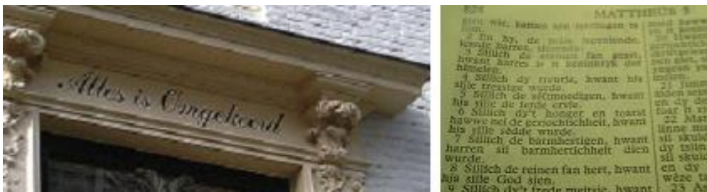
De naam van een huis in Middelburg (links) en een stukje uit de Bergrede (rechts), uit de Friese Bijbel, ook al zullen de Friezen wel nooit meer heer en meester in Dorestad worden.