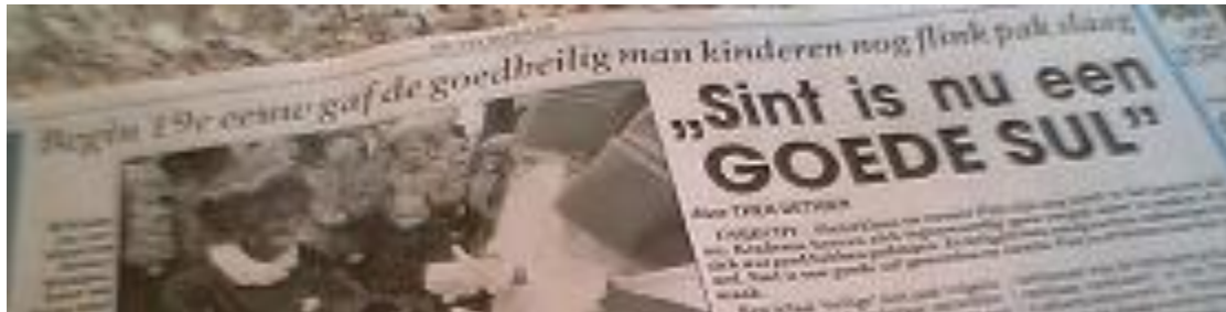
Vroeger had de sint nog gezag, nu is hij 'een goede sul'