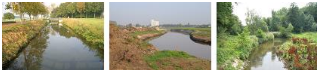
Het toonvoorbeeld van een beek 'normalisatie', wat is 'normaal'? (links). Dan de Grote Molenbeek tussen Meerlo en Wanssum, zoals je ziet zijn de bochten vers gegraven (midden). Daarna de ge-re-natureerde Vloedgraaf bij Susteren. Je ziet dat zoiets fraai kan uitpakken!

Wij zitten nu in een andere tijd. In Nederland - en zeker ook in Limburg - is vanaf de jaren 90 het besef gegroeid dat wij anders moeten omgaan met ons watersysteem, een en ander werd nog versterkt door de verandering van het klimaat. Ondermeer door het verloren gaan van de sponswerking van de bodem werd verdroging in de hand gewerkt, terwijl in natte tijden de afvoerpieken verhevigden. Voor Limburg zit daar nog een aparte dimensie aan. Onderzoek toonde aan dat in het gehele stroomgebied van de Maas, tot in Frankrijk toe de sponswerking sterk was afgenomen als gevolg van het volbouwen van het winterbed, ontbossingen en beeknormalisaties. Watersysteemherstel werd een belangrijk speerpunt van het Limburgs waterbeleid. Samen met de waterschappen werd vanaf dat moment gewerkt aan het herstel van de beken en de vernatting van natuurterreinen, waarbij vaak weer werd gekozen voor hermeandering met de mogelijkheid van natuurlijke waterberging. Ook werd de boeren werd geleerd om bewuster om te gaan met water (bereggen op maat). Het resultaat is dat langzamerhand de verdroogde natuur zich kan herstellen, terwijl de boeren minder behoeven te bereggen. De in mijn studententijd rechtgetrokken beek meandert weer!